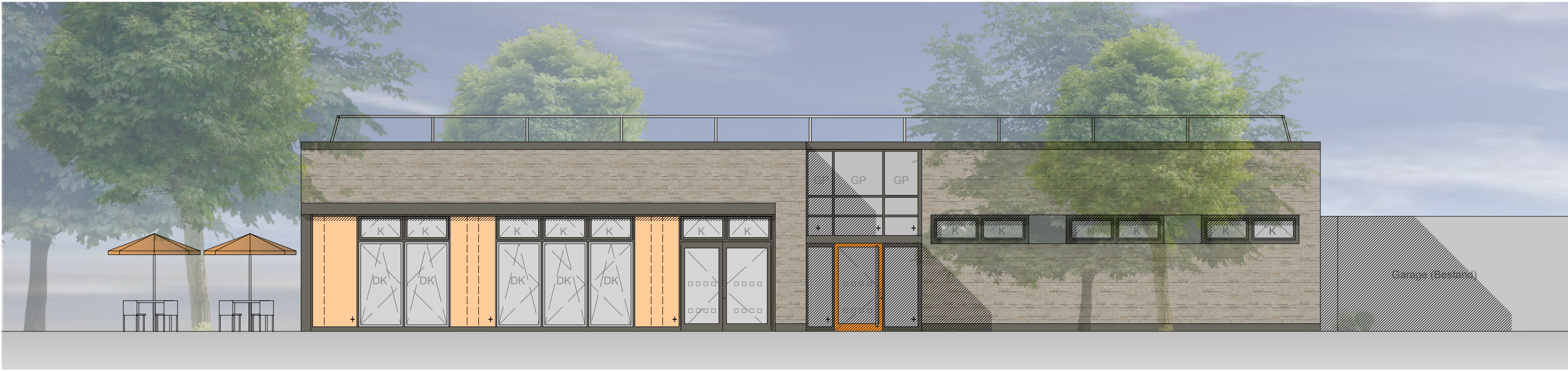
Ansicht Süd (Haupteingang)