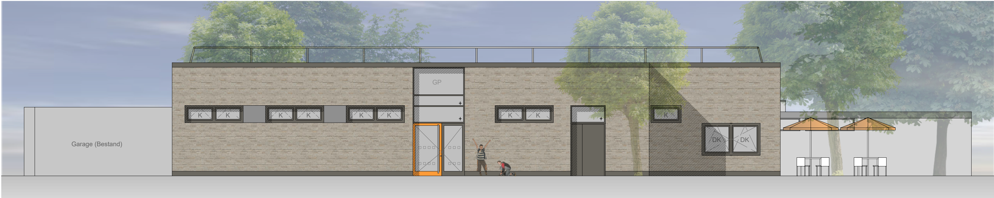
Ansicht Nord (Sportplatz)